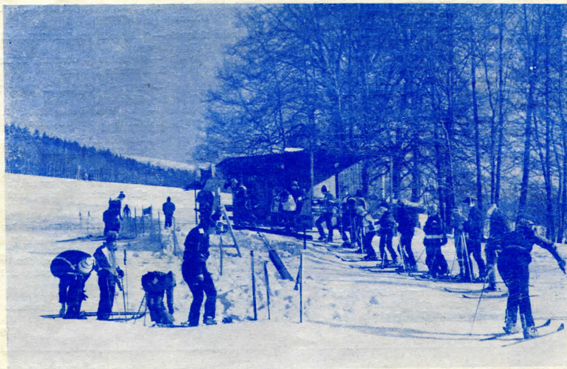
Dvěma záběry Jaroslava Pacholika se ještě vracíme k letošní zimě Na prvním snímku je rekonstruovaný lyžařský vleč — druhý obrázek je z letošního „Krkonošského maskarního reje“ v únoru